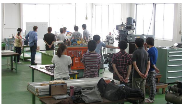
図 3 安全講習会の実施風景