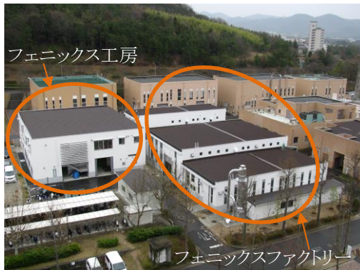
図1 ものづくりプラザの外観