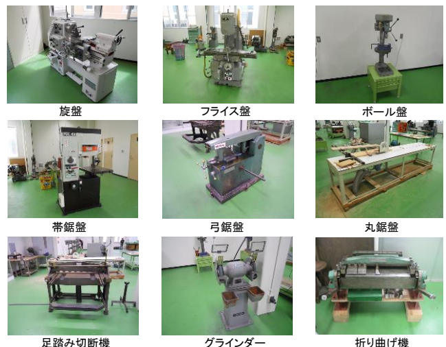
図2 フェニックス工房の主な工作機械