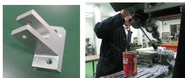
図 4 学生の製作品および作業風景

作業は夏季休暇期間であり、1 日中作業できたこともあり、学生は作業 2 日目の途中には本パーツを完成させていた。