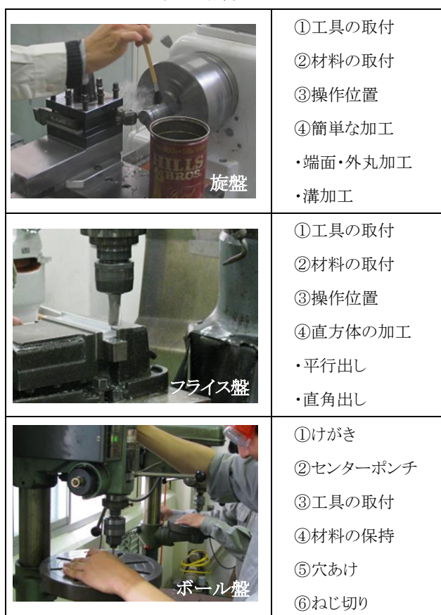
表 2 安全講習会の実施内容

フェニックス工房には、原則技術職員 1 人が常駐し、利用者への指導・支援を行っている。しかし、多数が同時に利用する際には、職員の目が届かない状況も想定される。このような場面での安全を確保するため、利用を希望する学生には利用申請と合わせて、研究室・チーム等单位で、安全講習会の受講を義務付けている。講習会は、希望者があった場合の第 3 金曜日に実施している。講習会では、職員が作成した安全の手引きを資料として、機械の基本的な取扱方法および安全に利用するための注意点などを指導している。実施内容を表 2 に、実施風景を図 3 に示す。