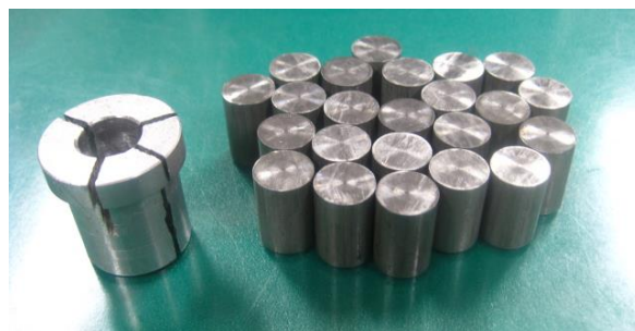
(a) 製作した治具と試験片

治具は保管していれば、いつでも使用できるため以降の作業においても学生は治具を使用して自分の手で試験片の作成を行っている。