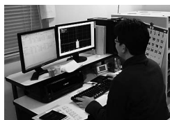
放射性同位元素の 同定作業