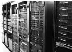
各種サーバ群 (WWW, メール等)