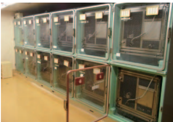
図 2. 改善後(マーモセット用)

等), 給餌, ケージ洗浄, 体重測定, 採血, ホルモン投与, 採卵などの作業を行っている. マーモセットは下痢を頻発することが知られており, 当施設においても下痢をする個体が存在する. 必要に応じて下痢止めや補食等を与え, 下痢の改善を試みている. また, 個体同士の闘争も度々起こるため, 最適なペアリングを試み, 相性を検索しながら, 飼育管理を行っている.