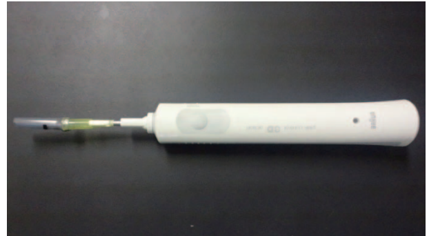
図 3. 精子採取用の電動歯ブラシ

精子採取には, 性成熟に達したマーモセット(EDM: C.Marmoset (Jic))の雄個体 6 匹(48~84 ヶ月齢)を使用した. 精子調整用および体外受精用の培地には, TYH と IVF100(株式会社機能性ペプチド研究所)を使用し, それぞれの培地で検討した. 電動ハブラシにラット気管送管用チューブを装着し, 振動で陰茎を刺激して採取を試みた(図 3).