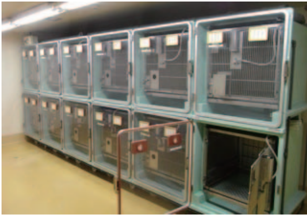
図 1. 改善前(ニホンザル用)