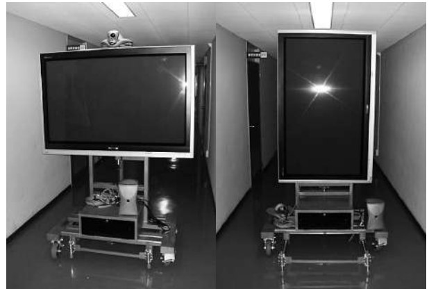
依頼工作（昇降回転機能付き58型テレビ台）