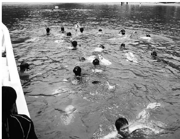
シュノーケリング講習