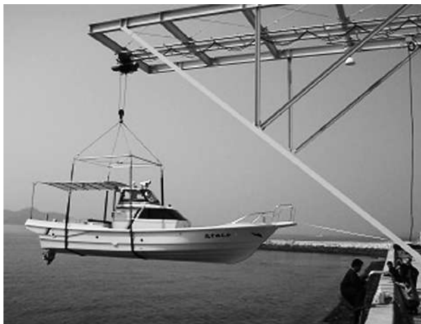
小型船舶を吊り上げている様子