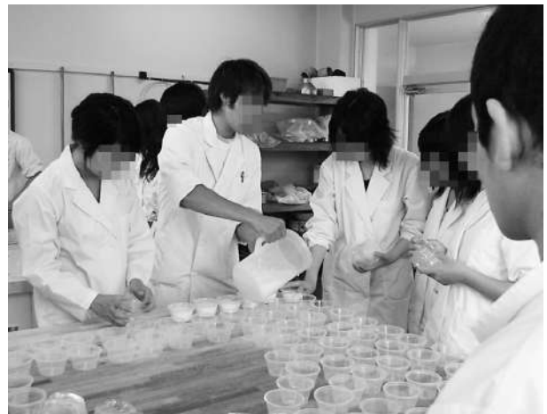
畜産食品製造学の実習（乳製品）