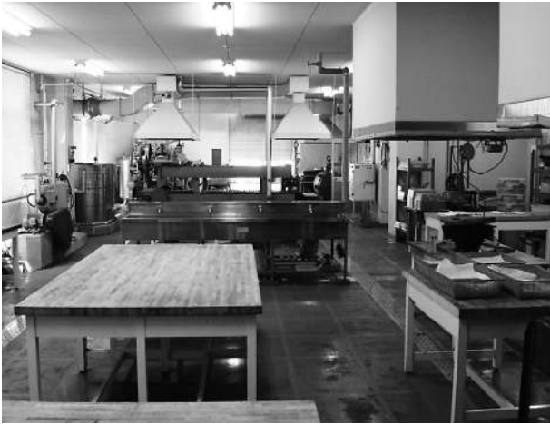
水産練製品缶詰製造室