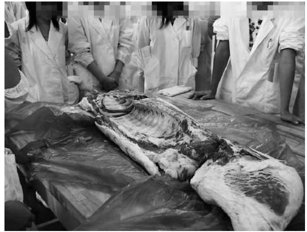
畜産食品製造学の実習（畜肉製品）