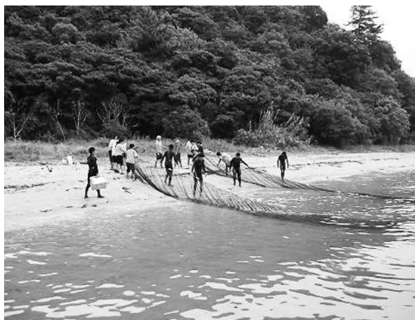
地曳網を使った魚類のサンプリング