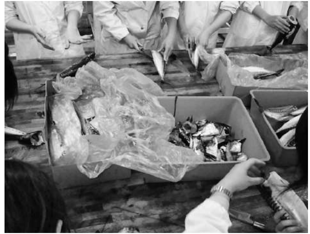
水産食品製造学の実習