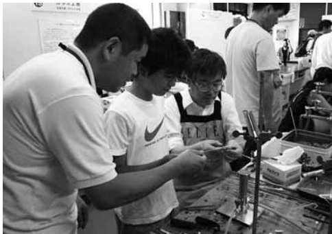
トンボ玉の製作風景

電子レンジとマイクロウェーブキルンによるガラスの溶融（ガラスアクセサリーの製作）土台となる板ガラスの上に模様をついたガラスチップを乗せる作業なので小学生を対象とした。