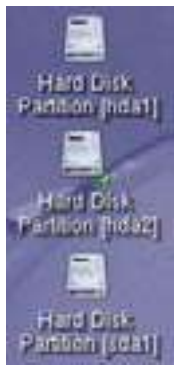
図 2 拡大図

され、フォルダ形式で表示される。問題があるとマウントすることができずエラー表示される。またマウントすると図 2 の真中のアイコンのように右下に緑色の三角形が表示される。