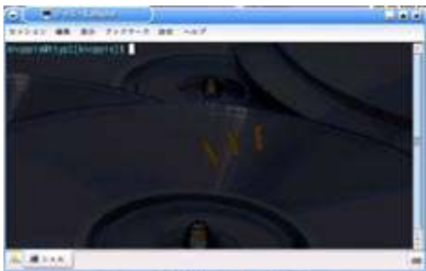
図 4 ターミナル

図 4 のターミナルをクリックすることでコマンドが入力できるようになる。修復するために以下のコマンドを入力した。