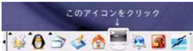
図 3 ターミナルの起動

画面下部にあるアイコンをクリックするとターミナルが開く (図 3, 4 参照)。