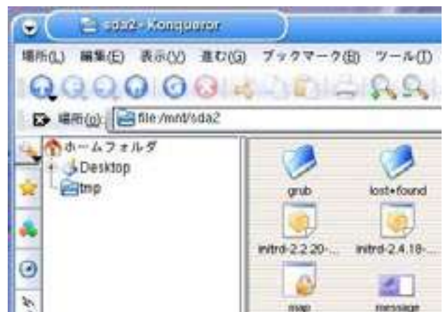
図 5 fsck 実行後のディレクトリ

実際行った結果 RAID システムの方は図 5 のように一部は修復されたが、その一方完全に修復されなかったファイル等は lost+found に格納された。