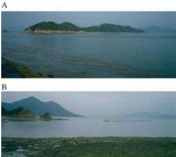
図3 A: 有竜島全景を北側から撮影したもの、B: 現在の有竜島西側に干潮時に現れる能地堆の一部

ヒガシナメクジウオと広島は、実に深い関わりを持っている。日本でナメクジウオ類が（学術的に）発見されたのは1881年広島県鞆での浮遊幼生の採集と、ドレッジ（海底の砂を集める道具）による成体の採集が初めてとされる。その後広島県三原沖の有竜島（有龍島、宇竜島、図3A）と呼ばれる無人の小島に続く砂洲から多数のナメクジウオが採集され、1928年にこの地域のナメクジウオが天然記念物に指定された。その地域は能地堆と呼ばれ、当時の干潮時には有竜島の西方から6 kmに渡って広大な砂洲が現れた（図3B）。